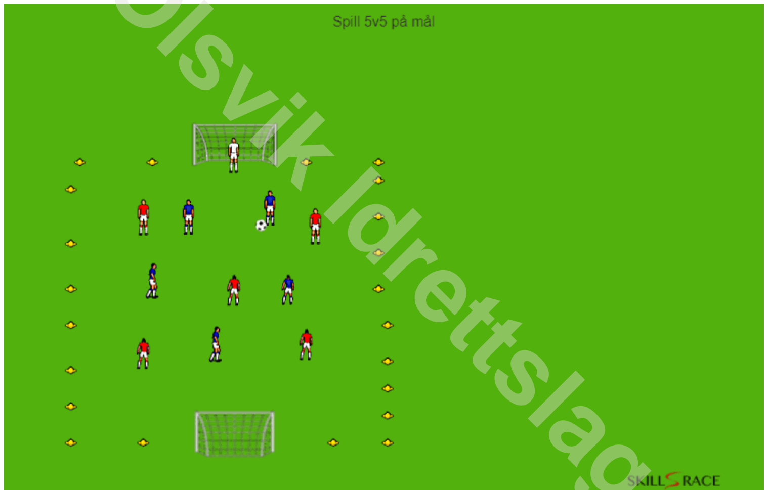
Fig.1 Spill 5v5 på mål

Man kan her spille på vanlige 5er mål eller på dukkemål. Dersom man har 5er mål kan man gjerne bruke keeper i målet.