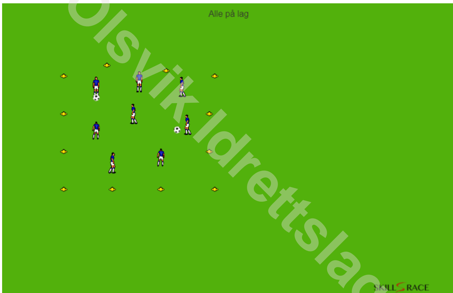
Fig.1 Alle på lag

Lag et område spillerne skal være i, man kan gjerne bruke 16m som utgangspunkt (avhenger selvfølgelig av antall spillere)